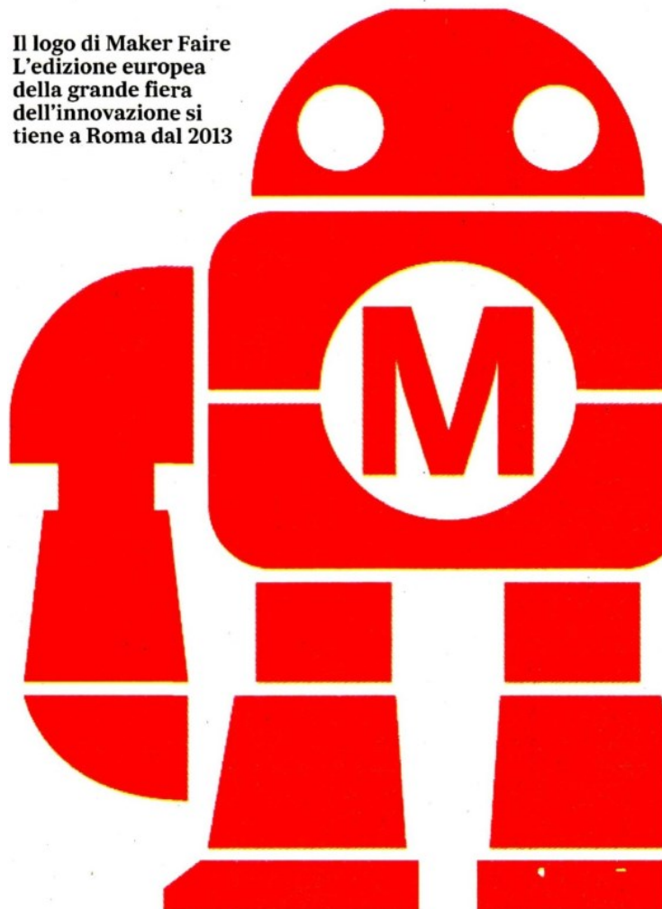
Il logo di Maker Faire L'edizione europea della grande fiera dell'innovazione si tiene a Roma dal 2013

TUTTA LA FIERA A PORTATA DI TABLET Ecco la schermata della piattaforma online che accoglierà i visitatori dell'ottava edizione di Maker Faire Rome. Per avere accesso gratuitamente al sito basterà registrarsi sul sito makerfairerome.eu